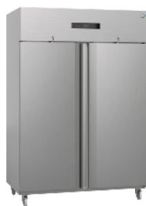
Advance 140 C